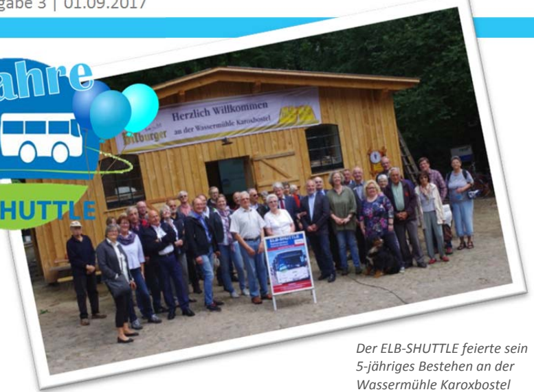
Der ELB-SHUTTLE feierte sein 5-jähriges Bestehen an der Wassermühle Karoxbostel