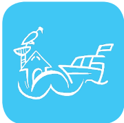
Tourismus, Naherholung und Naturschutz