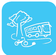
Verkehr & Mobilität