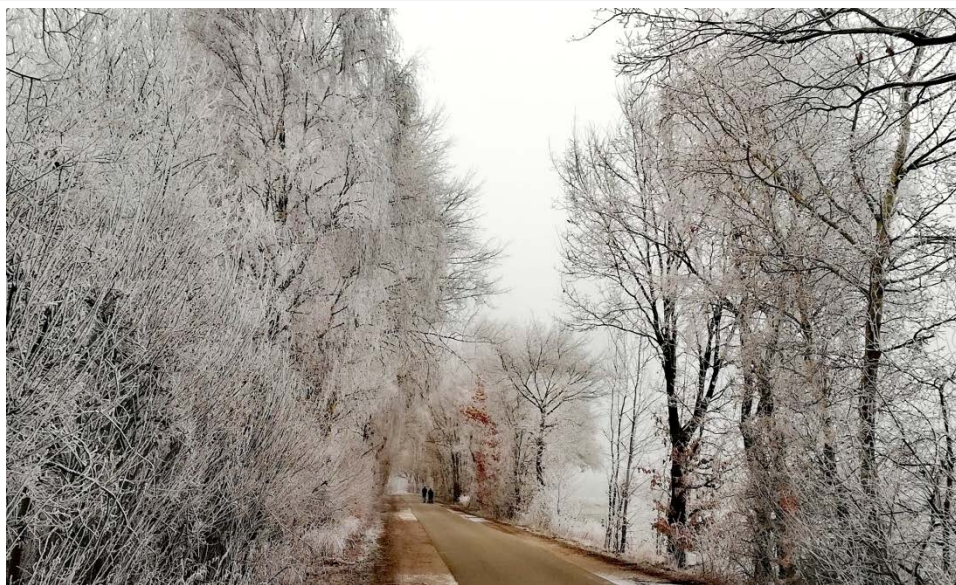
WINTERLICHE GRÜßE AUS DER LEADER-REGION ACHTERN-ELBE-DIEK